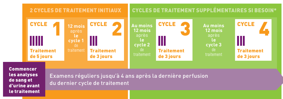
Figure 1 : Durée des effets du traitement et durée du suivi requis

* Note : Une étude ayant suivi les patients pendant 6 ans après la 1 re perfusion (cycle 1) a montré que la majorité des patients n'avaient pas besoin d'un cycle de traitement supplémentaire après les 2 cycles de traitements initiaux.